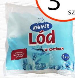
LÓD W KOSTKACH RENIFER 1 kg