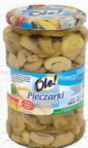
OLE PIECZARKI KROJONE W ZALEWIE 800ml