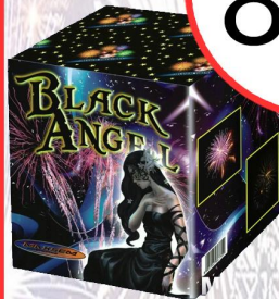
WYZRUTNIA GWM 6251 BLACK ANGEL