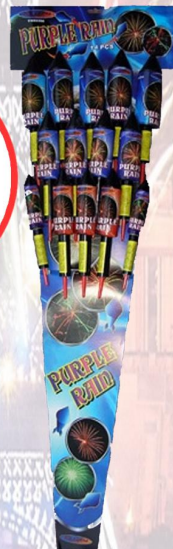
ZESTAW GWR 859A PURPLE RAIN