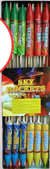
RAKIETA GWR 6101 SKY ROCKETS I