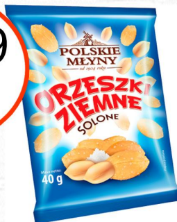
ORZESZKI ZIEMNE SOLONE POLSKIE MŁYNY 3x40g