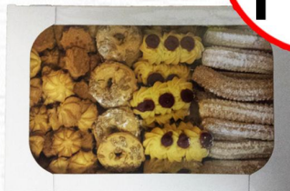
CIASTEczKA KRUCHE MIESZANKA FIRMOWA 700g