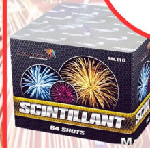
WYZRUTNIA MC116 SCINTILLANT