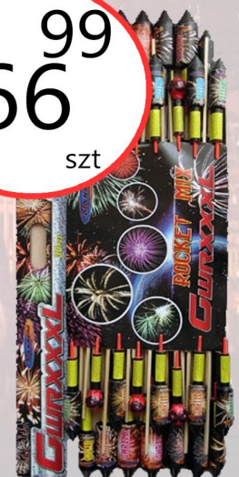
ZESTAW GWR XXXL

PEŁNA OFERTA FAJERWERKÓW DOSTĘPNA W MARKECIE GROSZEK