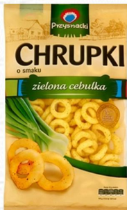
CHRUPKI PRZYSNACKI WYB. RODZ. 150g