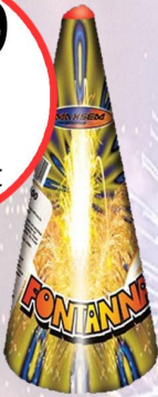
PETARDA WULKAN MF00-100